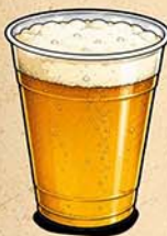
BIÈRES ET BOISSONS Yatabeer