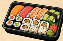
SUSHI Five Sushi