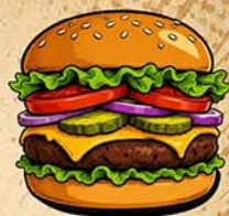
FISH & CHIPS ET HAMBURGERS