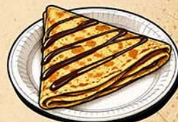
CRÊPES SUCRÉES & SALÉES La Valentine

Burgers généreux, fish & chips croustillants, crêpes gourmandes, sushis fondants... Une offre variée de food trucks, installés sur la place d'Isny, viendra compléter celle des restaurants et commerces du territoire afin de permettre au public de profiter pleinement de la soirée.